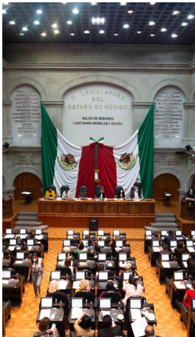
Salón de Plenos del Congreso del Estado de México.